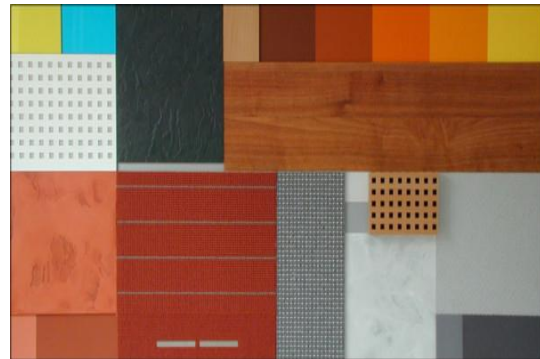
Die Teilnehmer des Seminars erstellen Farb- und Raumkollagen. Karl-Heinz Jahn ist mit Begeisterung dabei.

Einrichtungs- und Raumästhetik-Merkmale: